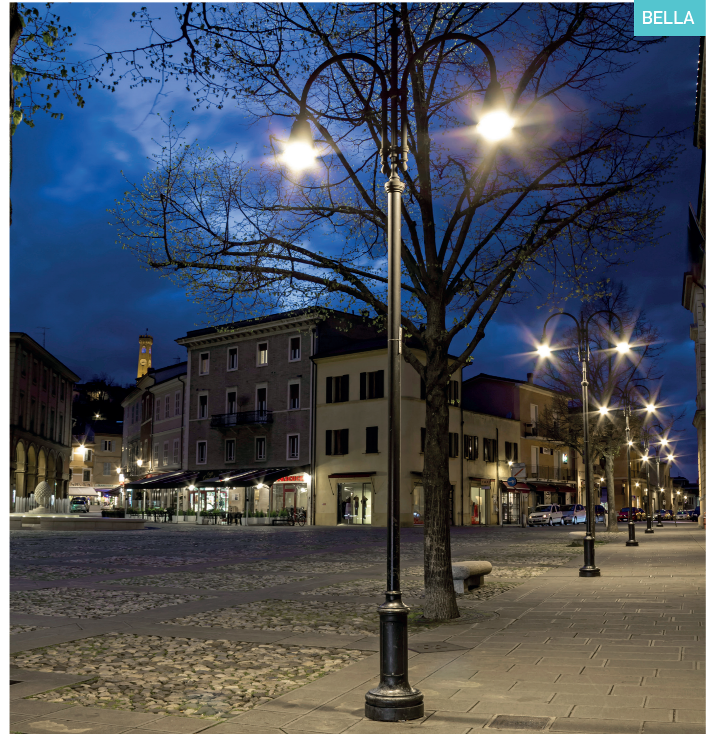
SANTARCANGELO DI ROMAGNA - ITALY

zum direkten Reflow-Löten auf Leiterplatten aus Reinstaluminium 15/10; LEDs elektrisch vom Wärmeableitungssystem isoliert, Konstantstromsystem (GS) zur LED-Ansteuerung (von 350 bis 700 mA). Verschiedene Einschalt-/Betriebsarten (RO, OF, DMP, DM, TLC, DA, NFC, NEMA, LUMAWISE, CLO); LITEK Wärmeableitungssystem TCS (Thermal Cooling System), redundant mit automatischer Sicherheitsüberwachung der Temperatur. Versorgung 110/240 Volt 50/60 Hz, phasenkompensiert auf \cos \phi \geq 0,95 , Schutzklasse 2 (auf Anfrage Klasse 1), elektronisches Vorschaltgerät mit Steuerung über höchst effizienten Mikroprozessor, voll mit Kunstharz vergossen (Made in Italy) mit Überspannungsschutz bis 10 kV im Common- und Differential-Mode, Nennleistung max. 46 W; Versorgung mit Schnellanschlusskupplung. Stoßfestigkeitsgrad IK08, patentiertes Kondensationsschutzsystem, äußere Schrauben aus Edelstahl, Gewicht 2,5 kg. CE-Kennzeichnung. Leuchte und Betriebsgerät Made in Italy.