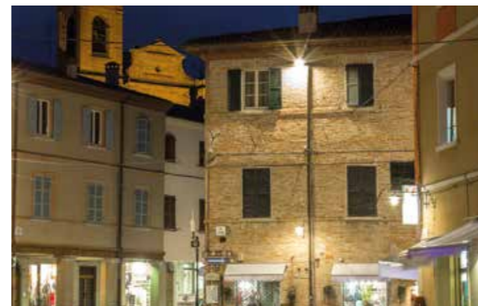
SANTARCANGELO DI ROMAGNA - ITALY