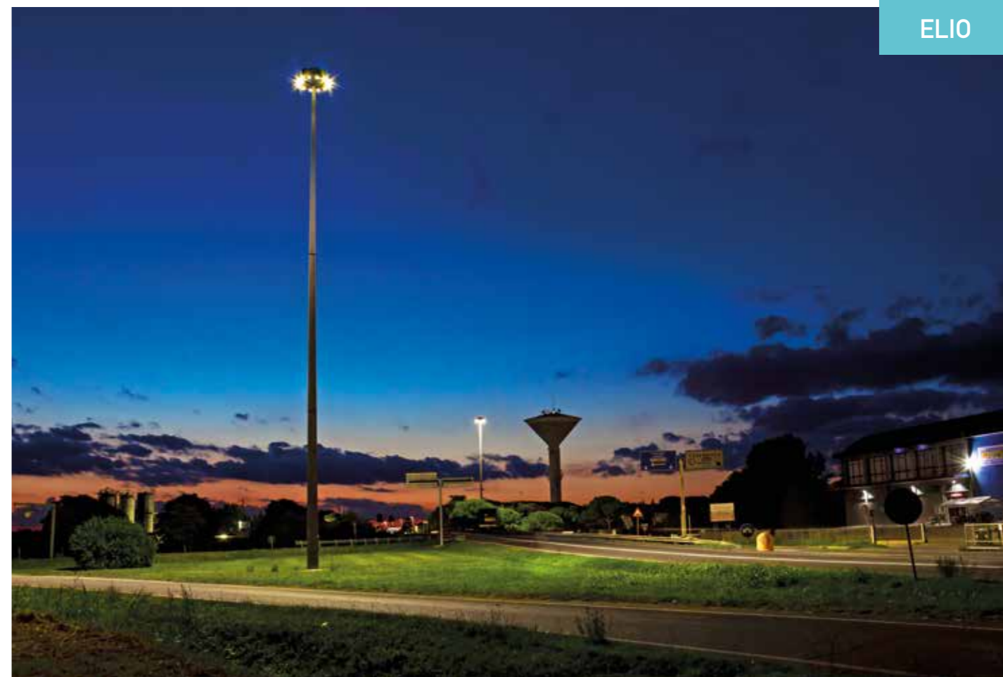
CESENATICO - ITALY

DMP, DM, TLC, DA, CLO); sistema LITEK di dissipazione calore TCS (Thermal Cooling System) ridondante con controllo automatico di sicurezza della temperatura, adatto anche per funzionamento h24. Alimentazione 110/240Volt 50/60Hz, rifasato a cos-fi \geq 0,95 , classe II di isolamento (classe I a richiesta), alimentatore elettronico con controllo a microprocessore ad altissima efficienza totalmente resinato (Made in Italy) con protezione da sovratensioni fino a 10kV sia di modo comune che di modo differenziale, potenza nominale max 125W. Apparecchio con grado di protezione IP66, coperchio vano accessori in PC caricato, scatola di connessione cavi con accesso separato da vano ottico, staffa di fissaggio parete/soffitto orientabile ad angolazioni di 10° in dotazione. Grado di protezione agli urti IK08, bulloneria esterna in acciaio inox, (disponibili a richiesta accessori per montaggio testa-palo), dimensioni complessive inclusa staffa 350x414x88 mm e peso 5 Kg. Certificazione internazionale CB, ENEC e marcatura CE. Apparecchio e driver Made in Italy.