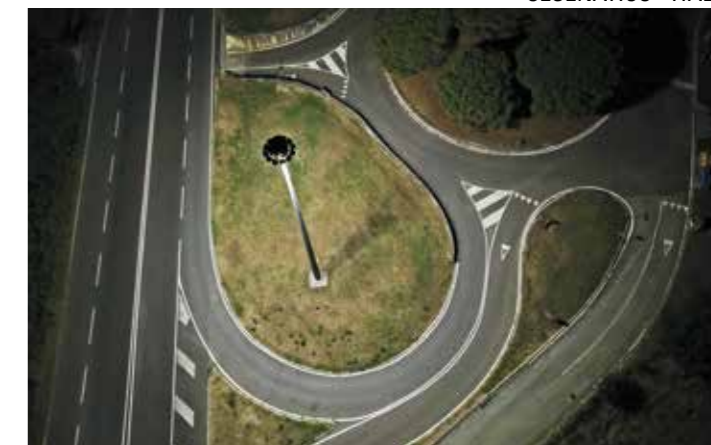
CESENATICO - ITALY

Projektor LED de alta performance de última geração (design LITEK R&D), em alumínio fundido. Design autolimpante e extremamente compacto com mínima exposição ao vento, projetado especificamente para a tecnologia LED. Ótica selada com proteção em vidro plano e temperado extra claro de 4 mm (ou fosco a pedido), tratamento protetor duradouro de pintura externa em pó de poliéster da cor "Antracite" RAL 7016 em relevo (RAL 9006 "Silver", ou outra cor, mediante solicitação). Ótica em PMMA com distribuição de luz variável. Luz padrão em tons neutros 4000 K (disponível a pedido com luz: quente 3000 K, muito quente 2700 K e muito quente 2200 K), ótica certificada totalmente cut-off contra a poluição luminosa. Grupos ópticos compostos por LEDs de potência MULTICHIP à base de cerâmica na versão STANDARD e LEDs de alta potência MULTIDIE nas versões ECO, com soldadura direta em circuitos de alumínio 15/10 puros; LEDs isolados eletricamente do sistema de dissipação de calor, sistema de alimentação por LED em corrente constante Vdc (de 350 a 700 mA). Diferentes tipos de operação / ignição (RO, OF, DMP, DM, TLC, DA, CLO); Sistema de dissipação de calor