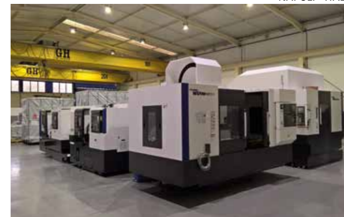
SANTA MARIA DE FEIRA - PORTUGAL

Projektor LED de alta performance de última geração (design LITEK R&D), em alumínio fundido. Design autolimpante e extremamente compacto, projetado especificamente para a tecnologia LED. Ótica selada com proteção em vidro plano e temperado extra claro de 4 mm (ou fosco a pedido), tratamento protetor duradouro com pintura externa em pó de poliéster da cor "Antracite" RAL 7016 em relevo (RAL 9006 "Silver", ou outra cor, mediante solicitação). Ótica em PMMA com distribuição de luz variável. Luz padrao em tons neutros 4000 K (disponível a pedido com luz: quente 3000 K, muito quente 2700 K e muito quente 2200 K). Grupos ópticos compostos por LEDs de potência MULTICHIP à base de cerâmica na versão STANDARD e LEDs de alta potência MULTIDIE nas versões ECO, com soldadura direta em circuitos de alumínio 15/10 puros; LEDs isolados eletricamente do sistema de dissipação de calor, sistema de alimentação por LED em corrente constante Vdc (de 350 a 700 mA). Diferentes tipos de operação / ignição (RO, OF, DMP, DM, TLC, DA, CLO); Sistema de dissipação de calor redundante LITEK TCS (Thermal Cooling