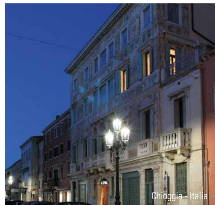
Chioggia - Italia