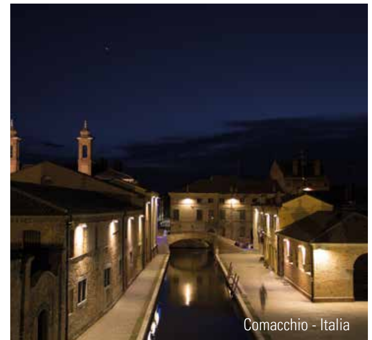
Comacchio - Italia