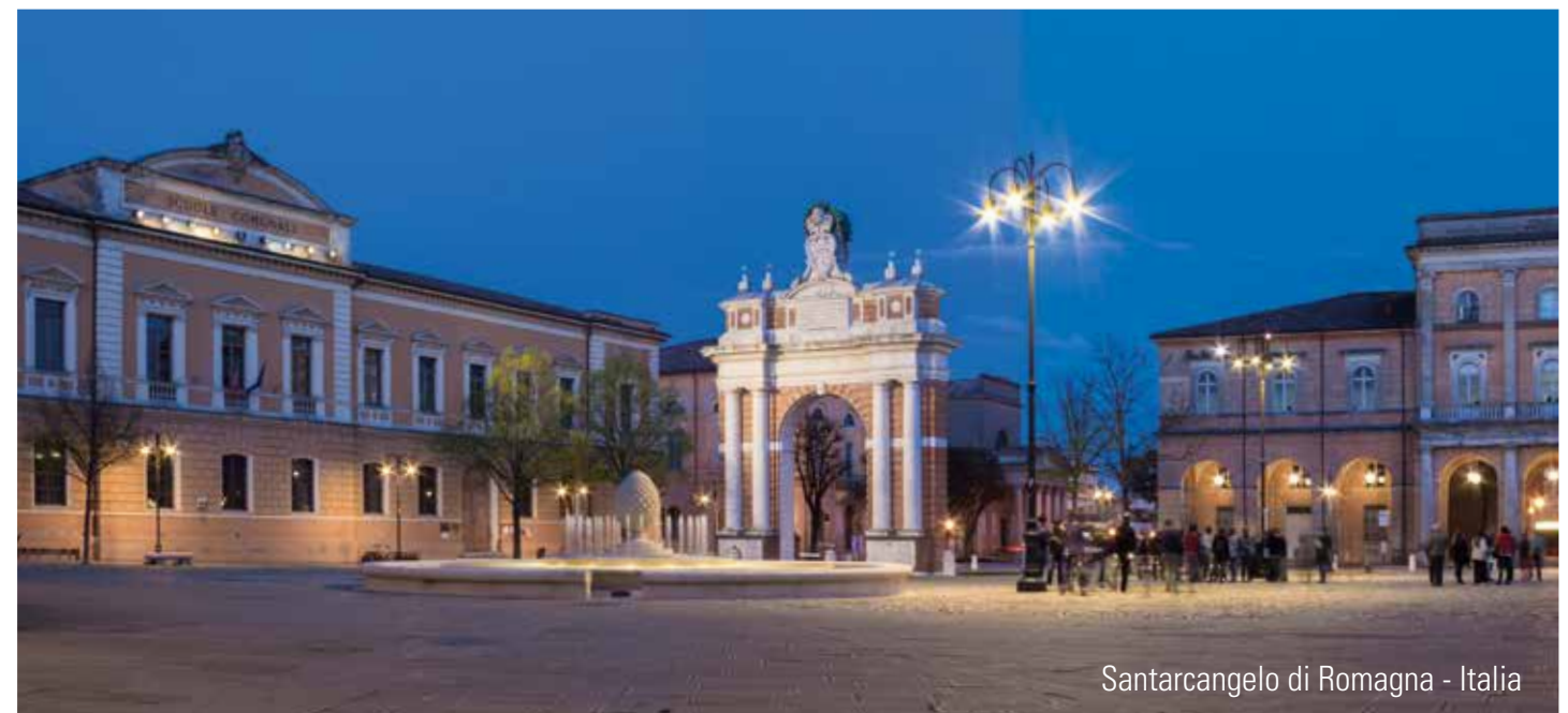
Santarcangelo di Romagna - Italia