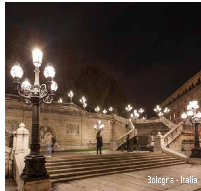
Bologna - Italia