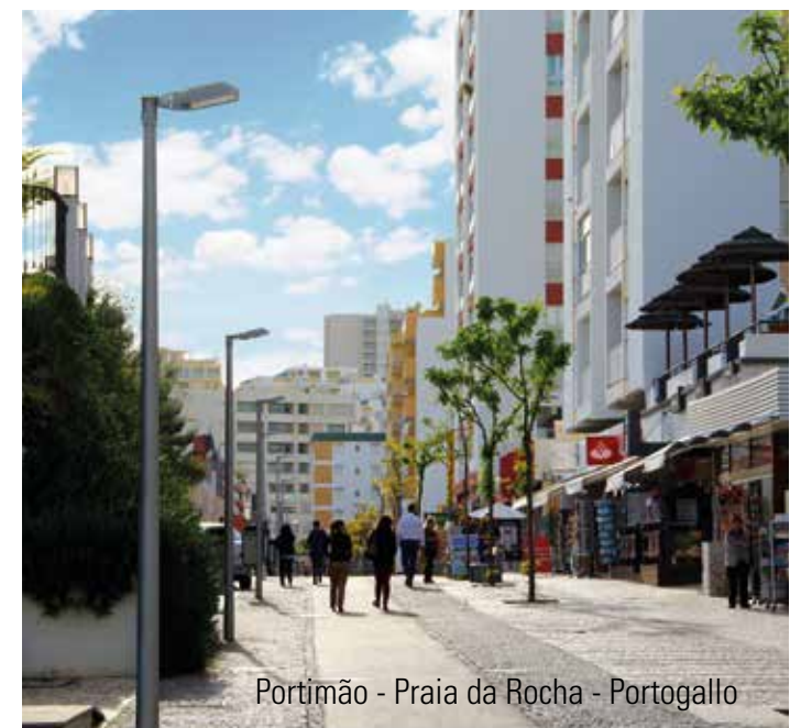
Portimão - Praia da Rocha - Portogallo