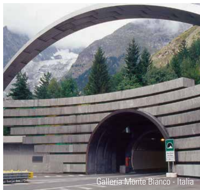
Galleria Monte Bianco - Italia