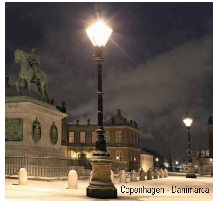
Copenhagen - Danimarca