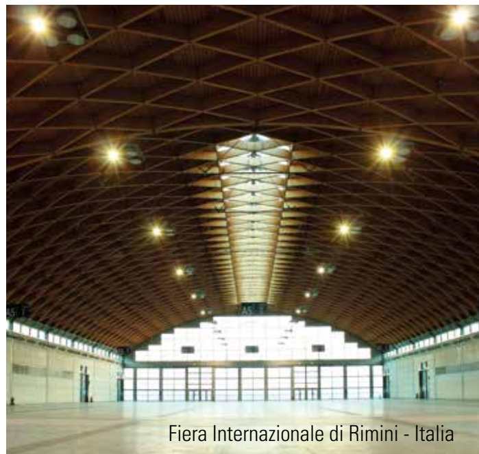
Fiera Internazionale di Rimini - Italia