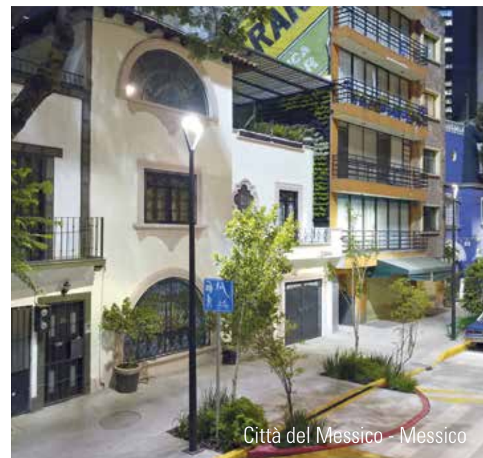
Città del Messico - Messico