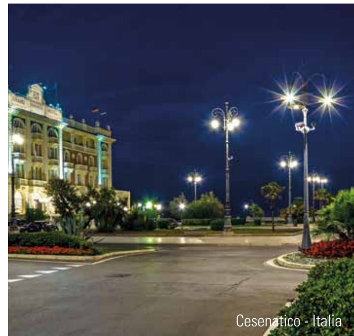
Cesenatico - Italia