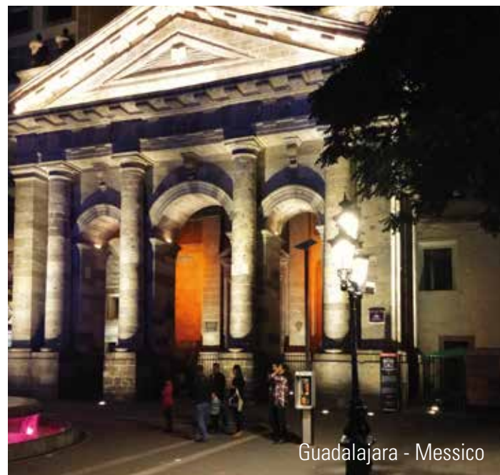
Guadalajara - Messico