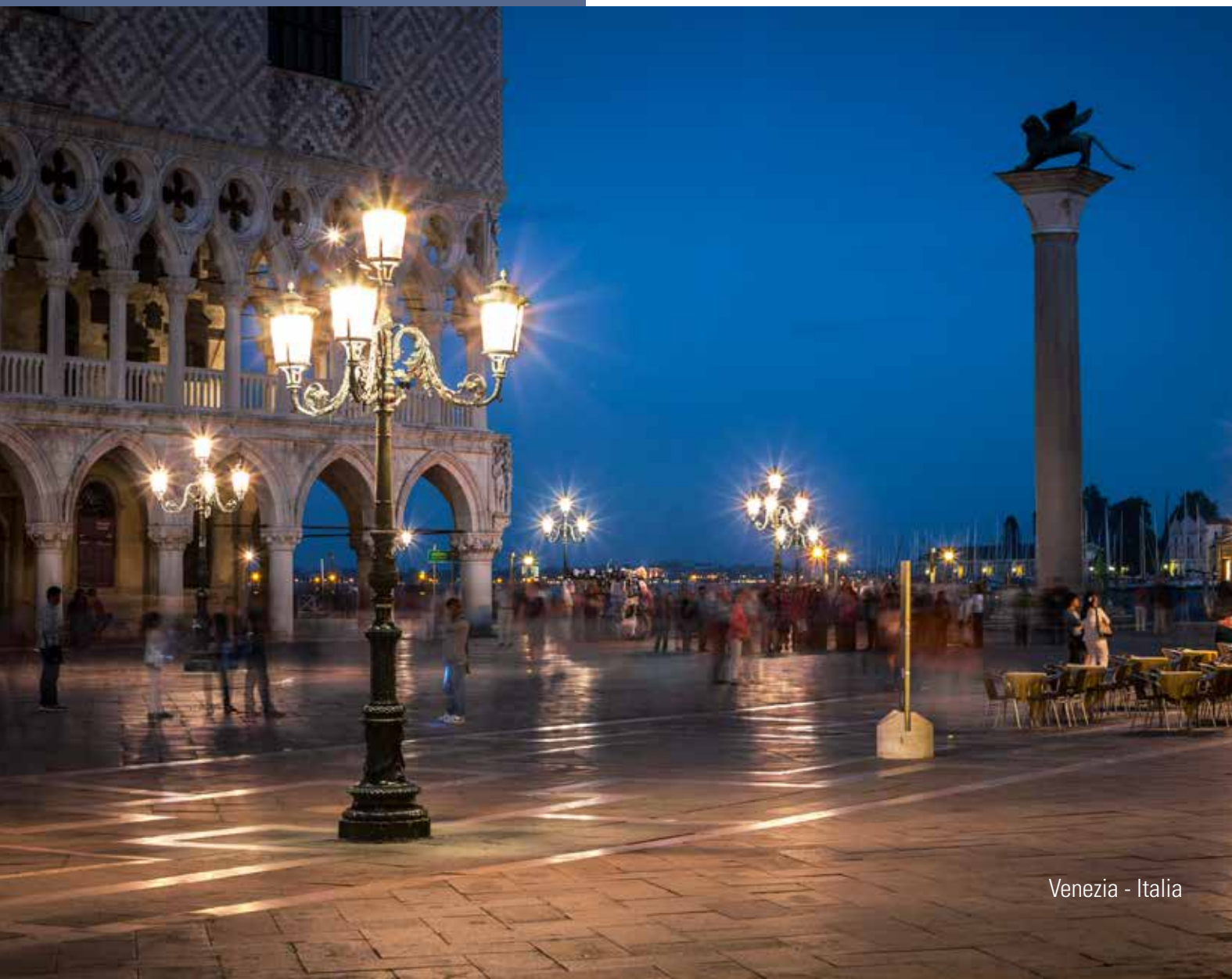
Venezia - Italia