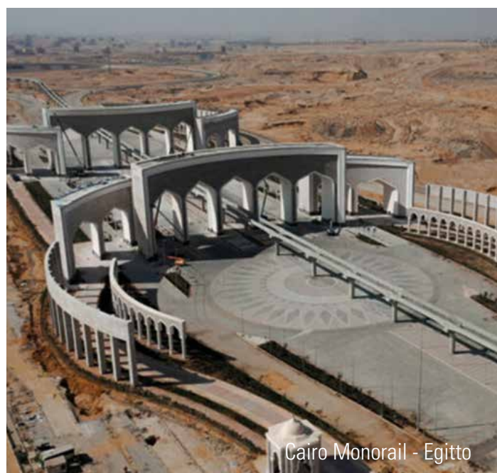
Cairo Monorail - Egitto