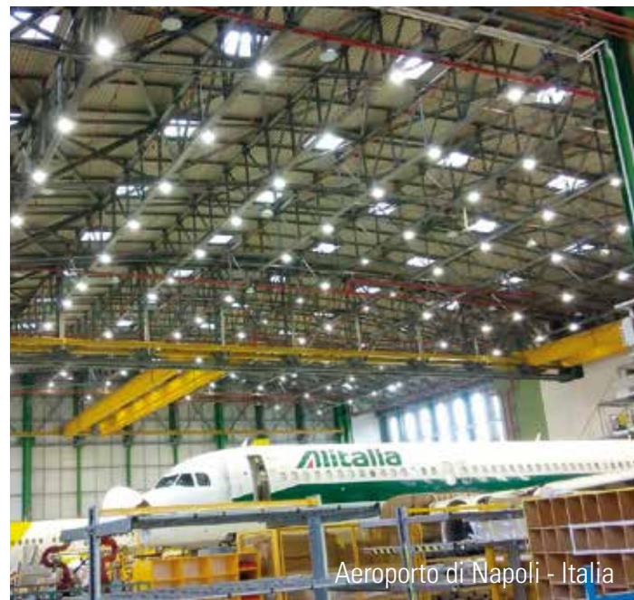
Aeroporto di Napoli - Italia