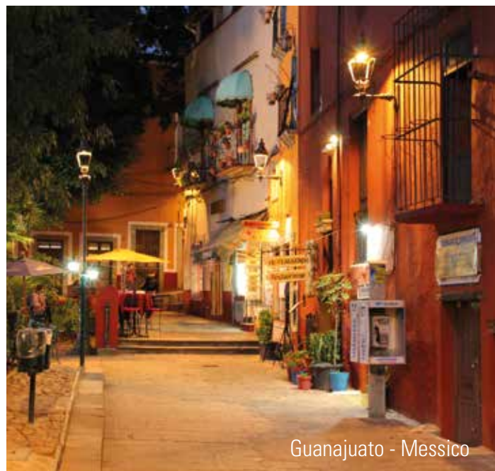
Guanajuato - Messico